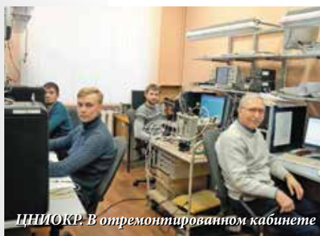
ЦНИОКР. В отремонтированном кабинете

Сейчас, после значительной предварительной работы мы приступили к ещё одному крупному объекту – ремонту большой столовой. Здесь задействованы все основные силы. Столовая будет не просто новая, а красивая, уютная и современная. Предстоит провести небольшую перепланировку, заменить отслужившее свой век оборудование. Делаем все основательно и быстро. Год юбилейный, и преобразование облика предприятия – одна из наших задач.