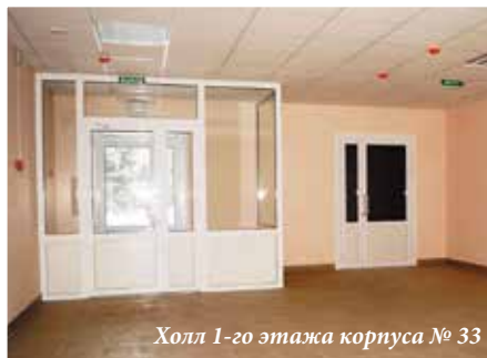
Холл 1-го этажа корпуса № 33

– Реконструкция предприятия – это целый комплекс работ, в котором участвует начиная с подготовки технологической планировки и заканчивая сдачей объекта целый ряд специалистов. Ремонтная служба завода включает в себя три основных подразделения: это 65-й цех (основное строительное подразделение), 63-й цех, занимающийся ремонтом и восстановлением всех инженерных систем, вентиляции, канализации, электрики, сантехники, и 60-й цех, изготавливающий нестандартное оборудование, металлоконструкции и т.д. Поэтому продукт нашей деятельности – результат совместных действий всех этих трех цехов. Однако строительство и ремонт мы не сможем начать, не привлекая специалистов из